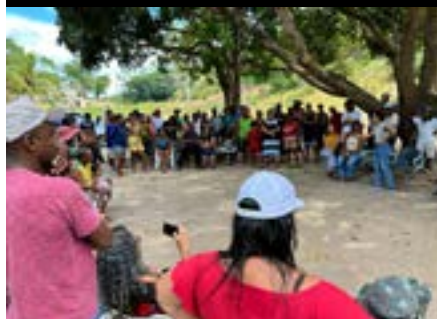
Visita técnica à Ocupação Vila Esperança em Vila Velha, 2023.