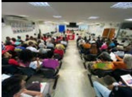
Audiência pública da Caravana dos DH de Linhares de Linhares, 2024.