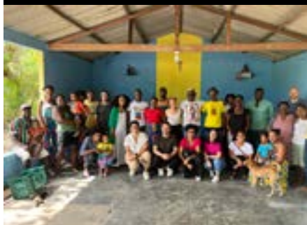
Visita à Comunidade Quilombola “Córrego do Alexandre” em Conceição da Barra, Caravana dos Direitos Humanos, 2023.