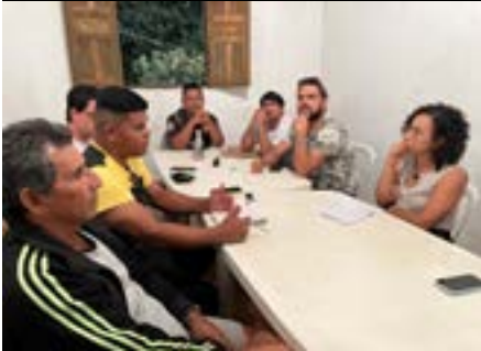
Reunião com Comunidade Indígena de Areal, na Caravana dos DH, Linhares, 2024.