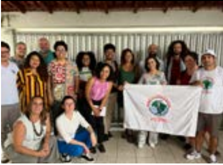
Reunião com a assessoria técnica dos atingidos e atingidas da Bacia do Rio Doce e litoral norte capixaba na Caravana dos DH, Linhares, 2024.