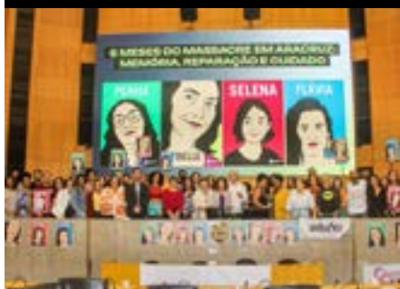
Audiência pública “6 Meses do massacre em Aracruz e a segurança nas escolas do Espírito Santo”, 2023.