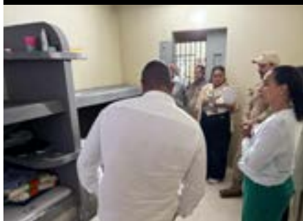
Visita à Unidade de Internação Socioeducativa de Cariacica, Caravana dos DH, 2025.