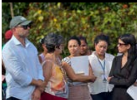
Visita técnica da Comissão Regional de Soluções Fundiárias do Tribunal de Justiça do Espírito Santo em Conceição da Barra, 2025.