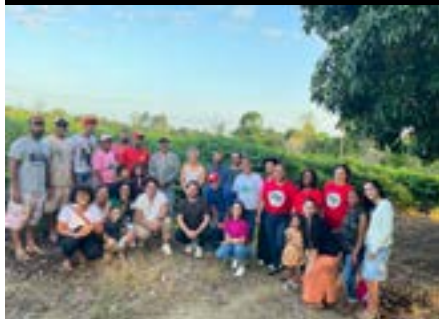
Visita ao Assentamento “Valdício Barbosa”, em Conceição da Barra, Caravana dos Direitos Humanos, 2023.