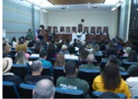
Audiência pública “Plano Pena Justa”, 2025.