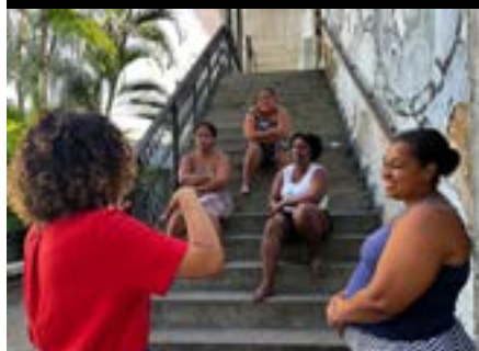
Visita à Ocupação Chico Pregó em Vitória, 2023.