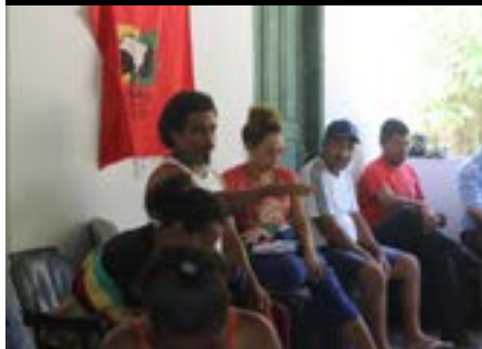
Reunião da Comissão Quilombola do Sapê do Norte, 2023.