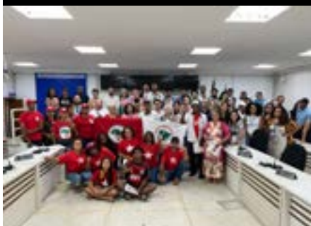
Audiência pública da Caravana dos DH de Linhares em Linhares, 2024.