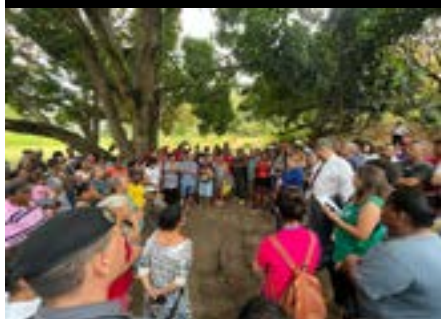
Visita técnica da Comissão Regional de Soluções Fundiárias do Tribunal de Justiça do Espírito Santo à Ocupação Vila Esperança, 2023.