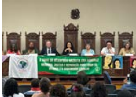
Audiência pública “2 anos do Massacre de Aracruz: solidariedade e reparação”, 2024