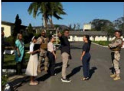
Visita à Centro Socioeducativo de Atendimento ao Adolescente em Conflito com a Lei (CSE), Caravana dos DH, 2025.