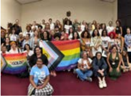
I Seminário LGBTQIAPN+, 2025.