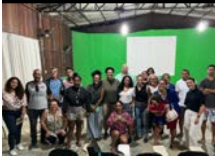
Reunião com lideranças no Centro Ecológico de Regência na Caravana dos DH de Linhares, 2024.