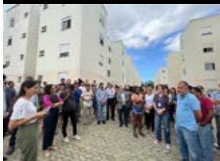
Diligência realizada pela Comissão de Soluções Fundiárias do TRF2 na ocupação do Condomínio Limão, em Cariacica, 2023.