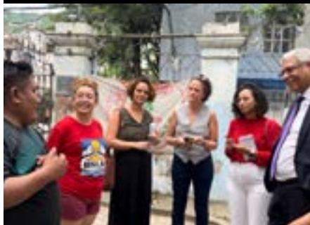
Visita técnica aos refugiados indígenas Warao na Ocupação Chico Pregó, Vitória, 2024.