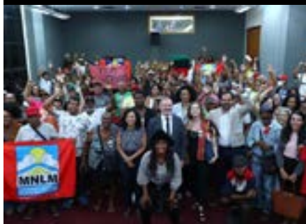
Audiência pública “Despejos no ES: ocupações de Vila Velha em debate”, 2025.