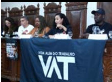
Audiência pública “Fim da Escala 6x1: trabalhar menos, viver mais”, 2025.