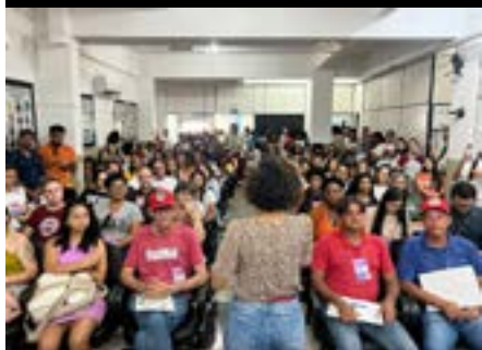
Audiência pública da Caravana dos Direitos Humanos em Conceição da Barra, 2023.