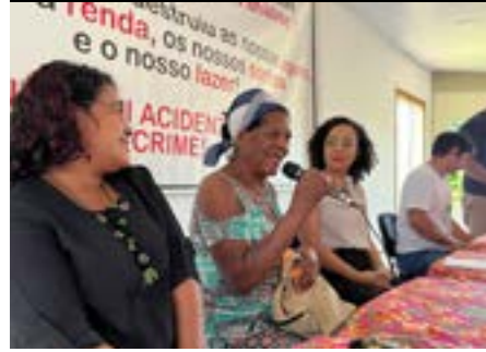
Reunião com Comunidade Quilombola de Povoação do Rio Doce, a Caravana dos DH, Linhares, 2024.