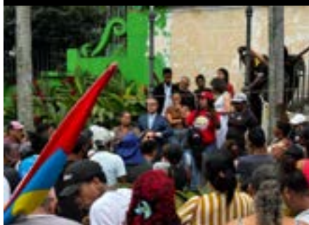
Ocupação do estacionamento do Palácio Anchieta após o despejo dos moradores de Vila Esperança, 2025.