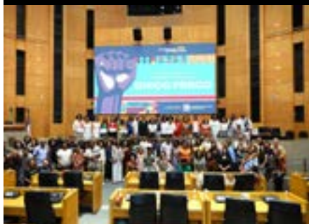
III Jornada Antirracista, Sessão Solene Chico Pregó, 2025.